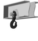
Крюк вращающийся на оси