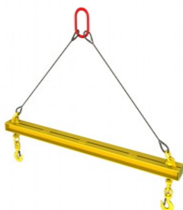
Линейная тип 2