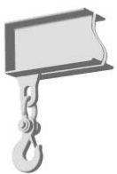
Крюк чалочный на скобе