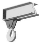
Крюк чалочный на оси