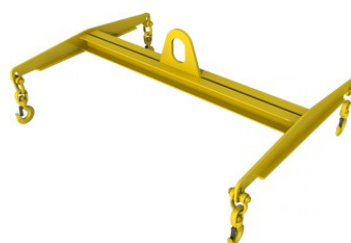
H-образные тип 3