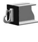
Крюк с торца