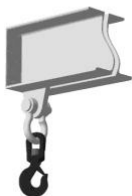
Крюк вращающийся на скобе