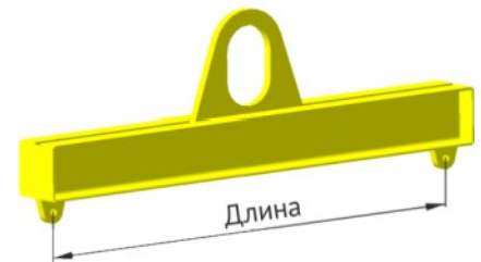
Конструкция по умолчанию