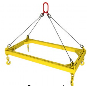
Рамные тип 4